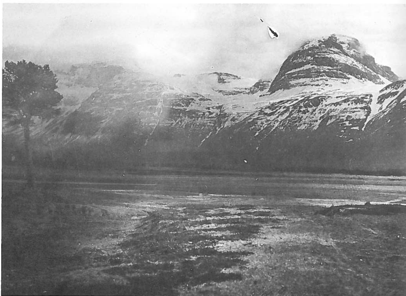
Den gamle markedsplassen på Abaja, Skibotn.

9. — 11. okt. i år ble det holdt seminar i Skibotn om Skibotnmarkedet. Dette gamle markedet ble belyst av flere foredragsholdere og det var også bygdekveld. Vi gjengir Olav Seppolas innledning til en samtale om markedet på bygdekvelde, og to av foredragene. Disse artiklene er illustrert med bilder av S. Paulaharju. Han var en kjent finsk fotograf og forfatter og besøkte Lyngen og Finnmark i 1927. Boka «Finnmarkens folk» var et resultat av turen. Det er ei svært lesverdig bok og anbefales. Han var særlig interessert i de områdene kvænene bodde og har derfor svært mye stoff fra våre kanter.