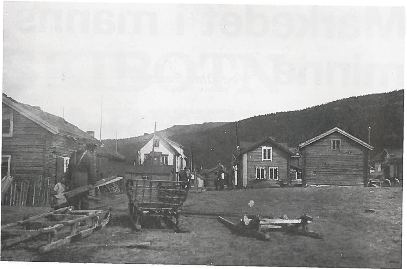
Fra Skibotn i 1927.