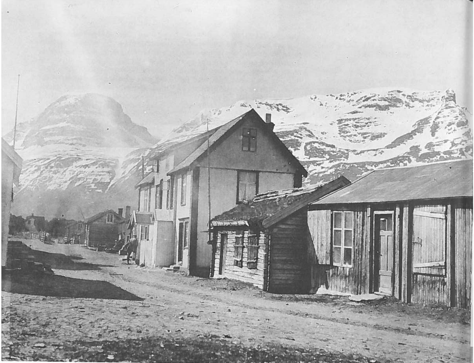
Bygdeveien på Skibotn med hotellet og markedsstuene.

ein markedsvott. Eg hadde nok fått skryt, i allefall så hugsar eg enno tydeleg at eg sat på den lille krakken attmed komfyren, i sterk konsentrasjon om arbeidet, og med ei sterk kjensle av at eg nok var flink. Men denne episoden er jo også eit bevis på at kvinnfolka på bygdene gjennom markeshandelen kunne skaffe seg lønna arbeid — til og med i forholdsvis ung alder!