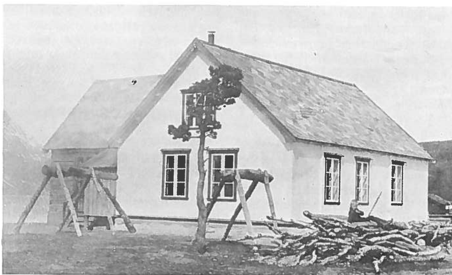
Bedehuset i Skibotn 1927.