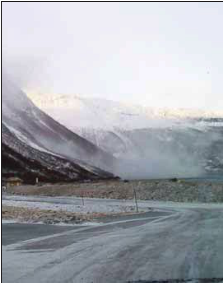
Et sneras gikk over tunneltaket og gamleveien og ned i sjøen mellom Båen og Skardalen lørdag morgen.